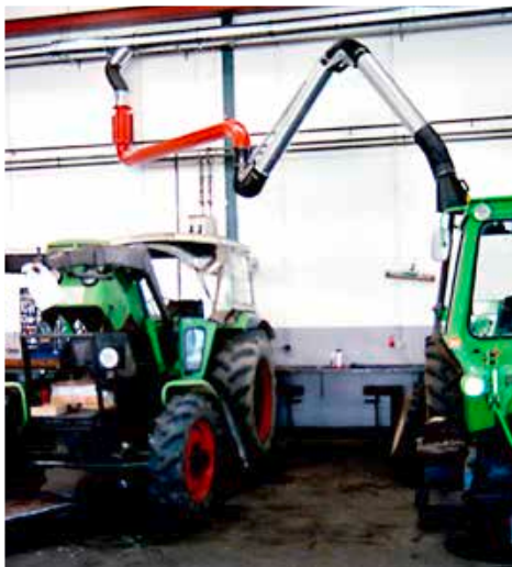
EXA-Schwenkausleger für Landmaschinen