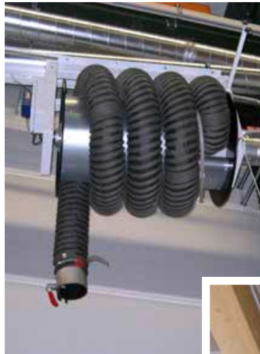
Links: Elektrischer Aufroller mit zentralem Ventilator. Unten: EXA-Absaugarm 4 m mit Ventilator