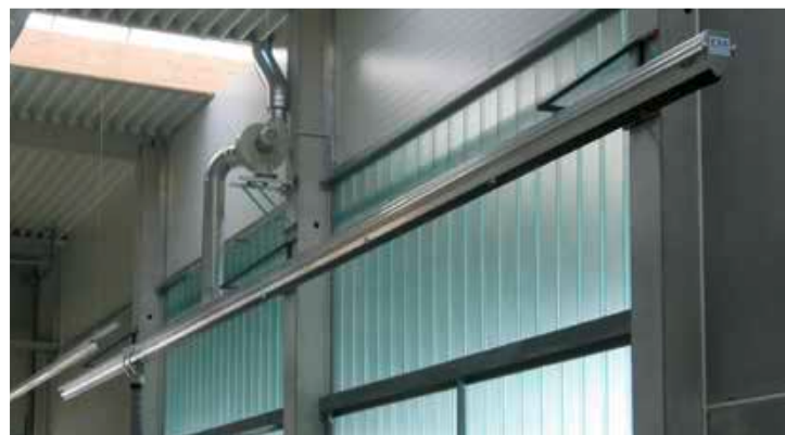
Oben: Saugschlitzkanal mit Schlauchwagen und leistungsstarkem Ventilator. Links: EXA-Spezialadapter für Mähdrescher und Häcksler